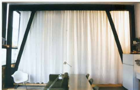
อาจารย์คณิศรและ-อรรณพ กับคู่ปรับรุ่นเล-ออกแบบเฟอร์นิเจอร์ในภัตตาคารในเม็กซิโกปี 2006

งานอีกชิ้นที่มีความคิดคล้ายกันคือ Domestic Claps เป็นการออกแบบชิ้นส่วนเชื่อมต่อที่มีลักษณะคล้ายคีมหนีบชั่วคราวให้ผู้ใช้งานสามารถสร้างเฟอร์นิเจอร์ด้วยตัวเอง หรือใช้สำหรับซ่อมแซมปรับเปลี่ยนรูปแบบเฟอร์นิเจอร์ที่มีอยู่แล้วให้แตกต่างจากเดิม เหมือนเป็นเฟอร์นิเจอร์ชิ้นใหม่ในบ้านได้ "จนถึงตอนนี้เราก็ไม่ได้ออกแบบหรือทำกันทีละชิ้น >>