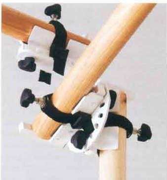
หน้านี้, Domestic Clamps, 2009 เป็นงานออกแบบชิ้นส่วนที่ใช้สำหรับเชื่อมท่อ ลวดแขวน หรือสร้างเฟอร์นิเจอร์ขึ้นในลักษณะลวดลายเป็นทรงซ้ำ จากซ้ายไปขวา Unlimited Edition Vessels, 2009 ภาพบน-กึ่งหน้าการบูรณะตกแต่งเครื่องถ้วยเคลือบสีและเคลือบฟอสเฟตเคลือบเป็นลวดลายชิ้นส่วนสำหรับต่อประกอบได้หลายวิธี Ornament and Crime, 2010 เป็นการนำเทคนิคการพิมพ์เครื่องเคลือบมาประยุกต์ใช้กับประติมากรรมแบบประติมากรรมปูนปลาสเตอร์ หน้านี้-ริ้วรอยของช่างที่ไม่เรียบของ Flawed, 2009 เป็นความตั้งใจที่เก๋ไก๋ที่นำจากกระบวนการผลิตไม้ไว้ เพื่อนำเสนอเอกลักษณ์ของช่างแต่ละคน

ของเฟอร์นิเจอร์ที่ใช้กันนั้นแต่เขาได้เครื่องมือในการประกอบหรือสร้างเฟอร์นิเจอร์ขึ้นมาอีกด้วย ด้วยความตั้งใจให้เป็นชิ้นงานที่มีราคาไม่แพง ทำให้ต้องอาศัยการผลิตจำนวนมากพร้อมเงินลงทุนค่อนข้างสูง ไปเจ็ทคือโอเคนี่จึงถูกพักไว้และยังไม่ได้นำมาผลิตจริง แต่เชื่อว่าวันที่ต้นแบบนี้สามารถหาเจ้าภาพเพื่อนำมาผลิตพร้อมวางขายในท้องตลาดได้จะเป็นการช่วยปลูกความคิดสร้างสรรค์ของคนทั่วไปและทำให้การประกอบเฟอร์นิเจอร์ที่บ้านง่ายขึ้นอีกเยอะ “หลายครั้งผมมองว่าลูกค้าคือคนที่เดินอยู่ในห้าง แต่จริงๆแล้วคนไทยมีถึง 50 กว่าล้านคน เราอาจไม่ได้ออกแบบสำหรับพวกเขาทั้งหมด แต่มันก็เป็นสาเหตุหนึ่งที่เราชอบทำงานกับช่าง เพราะเรารู้สึกคนธรรมดา และคนธรรมดาก็คือคนไทยส่วนใหญ่ที่เราพยายามสร้างสรรค์งานให้ ไม่ใช่สำหรับศิลปินหรือ ดั้งนั้นเราก็อยากออกแบบอะไรสักอย่างที่สามารถขายได้ในตลาดใหญ่หรือวางในร้านค้าได้ทั่วประเทศ” จากแนวทางการทำงานดังกล่าวทำให้กว่า 3 ปีที่เดินดูขยับตัวเองเข้ามาทำงานออกแบบในประเทศไทย เขาต้องพยายามปรับตัว ทำความเข้าใจ และเรียนรู้สิ่งต่างๆ มากมาย ทั้งเรื่องของวัฒนธรรม สังคม ความคิด และการเป็นนักออกแบบในเมืองไทย “ผมต้องเรียนรู้ว่าความยืดหยุ่นผมคิดว่ามันเป็นทั้งจุดแข็งและจุดอ่อนของคนไทย ผมพยายามทำความเข้าใจกับความเป็นคนสบายๆ ของชาวไทย และพยายามให้พวกเขาของสิ่งใหม่ๆ แต่ให้คนคิดแบบสบายๆ และยืดหยุ่นนี่ทำให้บางครั้งพวกเขาที่สบายๆ กับเด็ทไลน์ไปด้วย” แต่อย่างน้อยที่เดินดูและพรหมก็ยังมั่งมีสิ่งที่เป็นแรงขับ